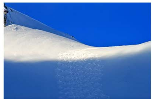
Bilder: Hüttenwirt Andreas Pobitzer